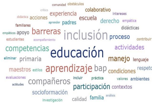
Figura 1 Nube de palabras

NOTA: Elaboración propia (Nancy Morales 2024) a partir de los datos obtenidos en Atlas.Ti